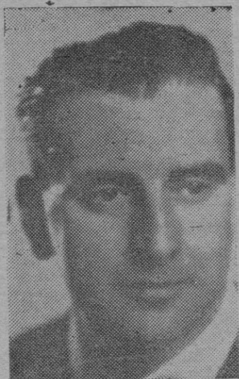
El Ministro de A. Exteriores

var la paz en esta zona del Mundo sino lógicamente transmitir ese depósito sagrado a los demás cuando la hora viniera. Es-