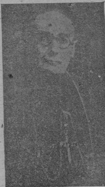
El Arzobispo Primado de Toledo gado más de veinticinco millones de pesetas, donadas por los fieles (Continúa al final de la primera columna de la 2.ª página)

oración compuesta por Su Santidad Pío XII; a este se han entre-