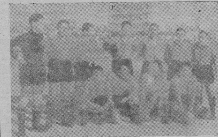
El equipo del C. D. Mallorca

incógnita que la pregunta encierra con un optimista sí. El Mallorca. Español que alzó el telón de la temporada era en realidad, más que un choque en el que se iba en busca de una victoria o un tanteo, la primera prueba a fondo, verdad, de los jugadores de uno y otro bando. Para los de acá — que son los que nos interesan —, el resultado fué plenamente halagüeño. Está fuera de duda que con los diez y siete que sacó Caicedo y