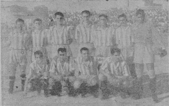
El equipo del R. C. D. Español