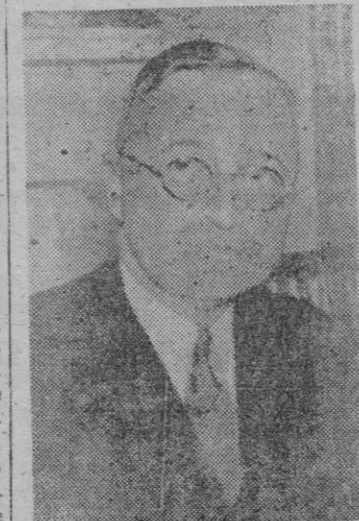
El Presidente Truman

mos la dura labor que nos espera. Nuestro pensamiento, por supues-