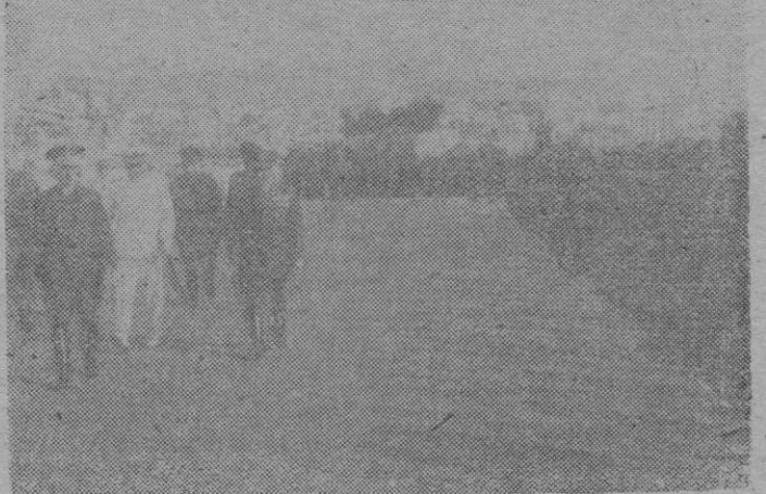
S. E. pasa revista a la fuerza que le rindió honores.