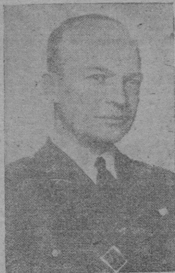
EL GENERAL EISENHOWER

máxima actualidad en todas partes. Hasta el extremo de que difícilmente podría un escritor profesional, cualquiera que fuese su especialidad, competir con éxito con un político, embajador o enviado especial, por buena que fuese la labor de aquel y en debile que resultara la de éste.