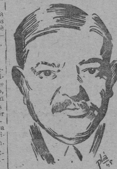
L A V A L

Paris.— Laval ha sido interrogado en la prisión de Frisnes, en donde se encuentra recluido. Igualmente ha sido sometido al interrogatorio el ex ministro de Vichy, Darnand.