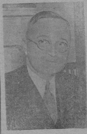
EL PRESIDENTE TRUMAN

tra el Japón por parte de Rusia ha sido solamente una de las decisiones militares de