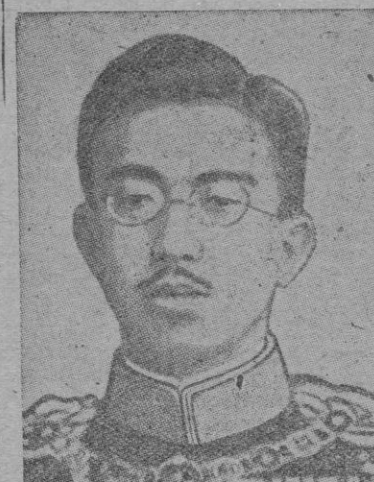
EL EMPERADOR DEL JAPON HIRO HITO

«Por orden de su Graciosa Majestad, que siempre desea fomentar la causa de la paz mundial y anhela seriamente seriamente provocar una pronta terminación de las hostilidades con vistas a salvar a la humanidad de las calamidades que