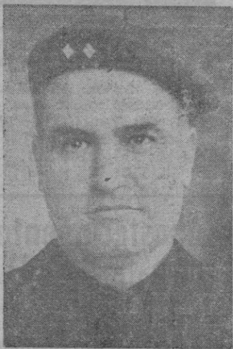
El Excmo. Sr. Ministro de Industria y Comercio