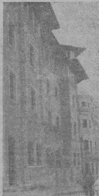
Vista de la fachada principal: la puerta central aparece todavía tapiada.

En el piso principal están el salón de actos y la biblioteca, comunes a ambos cuerpos. En la parte correspondiente a Telégrafos, el despacho del Delegado-Jefe del Centro, el del Secretario, el de la auxiliar mecanógrafa, la Habilitación e Ins-