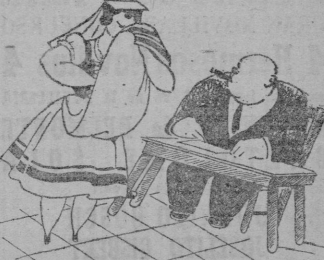
...¡Que trieste estoy sin ti!

Se espera que dentro de dos semanas estarán en condiciones de ser habitadas. Su alquiler costará 80 pesetas mensuales.