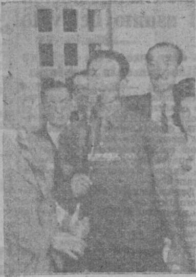
Madrid. — Delio Rodríguez, triunfador en la V Vuelta Ciclista a España, hablando ante el micrófono, inmediatamente después de la carrera.

En este festival en el que tomarán parte todas las nadadoras del "Palma" se vé un alicion de mercadísimo puesto que además de los nadadores ya conocidos aparecerán valiosos elementos nuevos entre los milites del C. N. Palma.