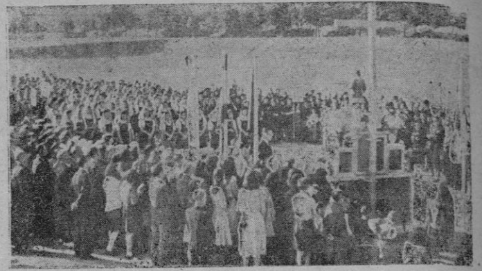
En la pradera de San Isidro de Madrid se celebró la tradicional misa a la que asistieron jóvenes de la Hermandad de la Ciudad y del Campo de la Sección Femenina, que después celebraron la oferta tradicional al Santo.