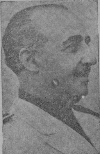
FRANCO, CAUDILLO DE ESPAÑA

No me sorprende ese entusiasmo en que florece vuestra fealdad, pues no en vano destaca Castilla a través de la historia por su viril firmeza y por su ejecutoria de fidelidad sentida al estilo castellano, que no es ni conformidad ni servilismo sino lealtad en el servicio de las nobles empresas. Valladolid fue cuna de muchos de los grandes movimientos nacionales; en nuestros siglos de oro aquellos regios españoles de Isabel y de Fernando que, uniendo con su yugo sus dos reinos, asentaban la primera piedra de nuestra unidad. Desde Valladolid se dieron leyes que, a la par que unificaban a España, redujeron el poder y los abusos de los grandes señores. Valladolid fue la cabeza de estas dilatadas tierras castellanas, de donde partían aquellas gloriosas expediciones que dieron impulso y remate a nuestra gloriosa reconquista.