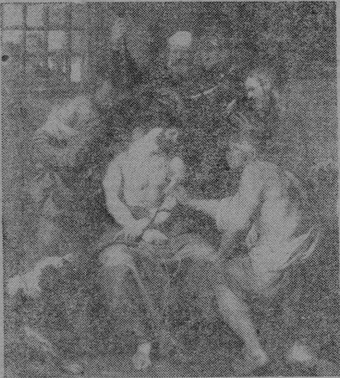
LA CORONACION DE ESPINAS, por Van Dyck

Van Dyck pintó la Coronación de Espinas. Hay en esta escena el duro realismo de la burla y la afrenta. Cristo no exhala una queja. Ha sufrido los azotes de los soldados romanos, y ahora permanece callado ante la afrenta y los ultrajes de estos bárbaros, ajenos a todo sentimiento espiritual. Es impresionante la callada actitud de Jesús entre los rostros de quienes le castigan.