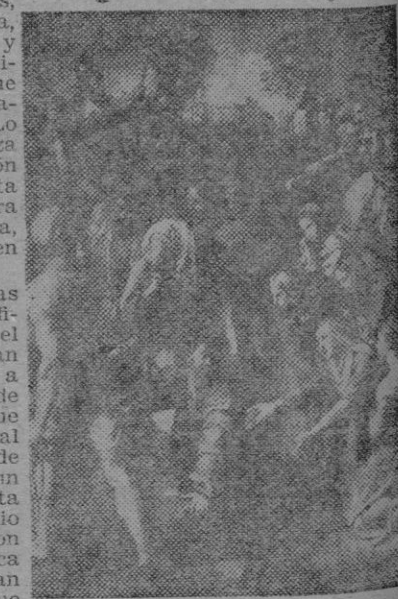
EL PASMO DE SICILIA, por Rafael

El orden de la procesión era el siguiente: En primer lugar