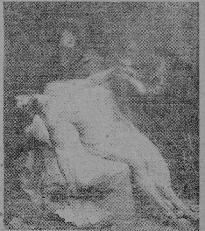
LA PIEDAD, por Rubens

Y el Santo Cristo, Rey verdadero, crucificado en un madero, abre los brazos con humildad a los que acuden a contemplarle devotamente, para rogarle que les conceda su Caridad.