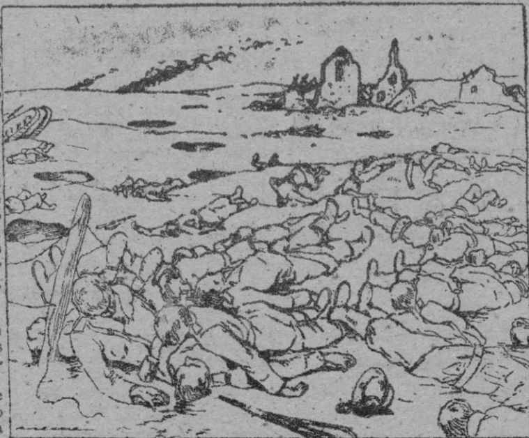
—Todo esto y mucho más, que no coje el dibujo, por un simple pabillo! (S.O.C.)