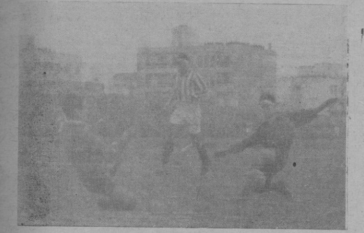
Albella, muy codicioso, pone el balón fuera del alcance de Casafont y marca el segundo tanto del Mallorca

eran de inapreciable valor: mallorquines y andaluces tenían un —2 en la clasificación. Los primeros querían no agravarlo; los segundos, neutralizarlo. Por eso, desde el — primer momento, entregáronse encarnados y blanquiverdes a una lucha desenfrenada, a fondo, rabiosamente decidida en busca de la ventaja. La competencia — pronto se vio — radicada singularmente entre las delanteras, ya