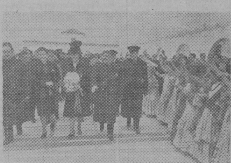
El Generalísimo, acompañado de su esposa, del Ministro Secretario, de Pilar Primo de Rivera, y otras personalidades. Inaugura dos nuevos centros de Auxilio Social con ocasión de su VIII aniversario.