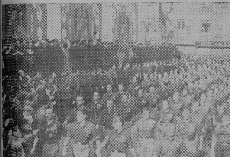
Comaradas de la Vieja Guardia desfilando ante las Jerarquías nacionales después de celebrado el acto conmemorativo de la fundación de la Falange en el Teatro de la Comedia.