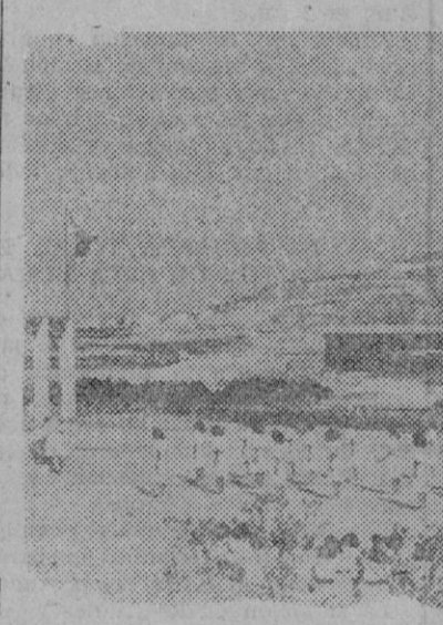
Los Albergues Femeninos su formación plena para el servicio de la Patria.

Mientras un grupo asiste a la clase de gimnasia rítmica, descansa, en perfecto orden, esperando su vez para actuar el Peñón de Cape. En primer término, la Cruz de los Albergues.