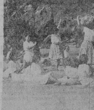
Las danzas, tanto regionales, como clásicas, se practican en los Albergues Universitarios Femeninos. Con el fondo maravilloso de este escenario natural, los cuerpos adquieren en la danza formas del más puro sabor clásico.

340 hombres de las partidas se presentaron a las líneas alemanas.