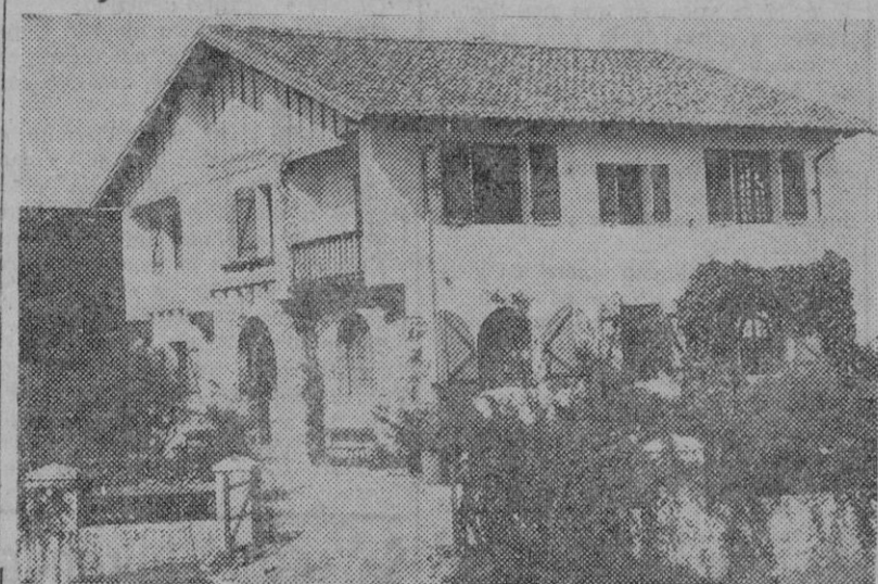
Edificio ocupado en Barro (Asturias) por uno de los Albergues Femeninos del S. E. U. de Madrid.

sus aptitudes fisiológicas es parte inexcusable de la formación total que se pretende lograr con los Albergues Universitarios.