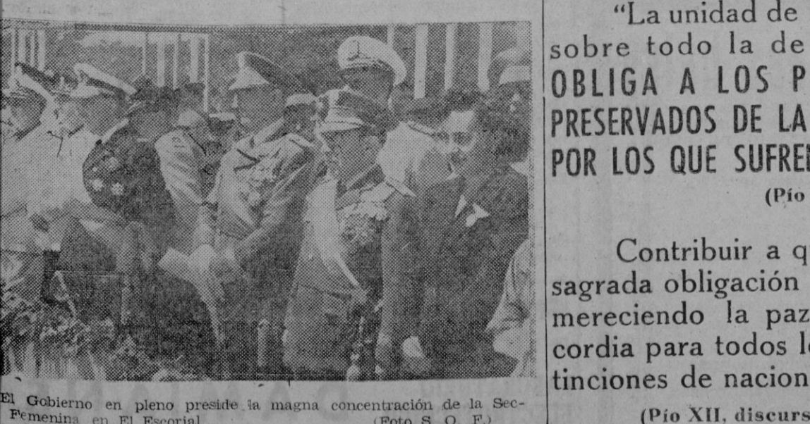
El Gobierno en pleno preside la magna concentración de la Sección Femenina en El Escorial.