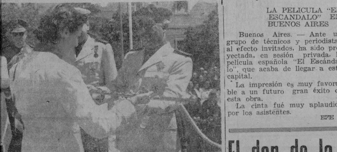
El Gobierno en pleno preside la magna concentración de la Sección Femenina en El Escorial.