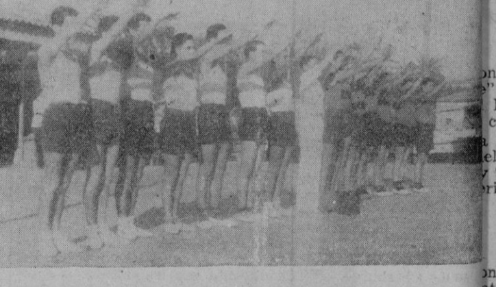
Los equipos de baloncesto de la Base Naval y de Infantería de la Marina antes del encuentro en que vencieron los de la Infantería.