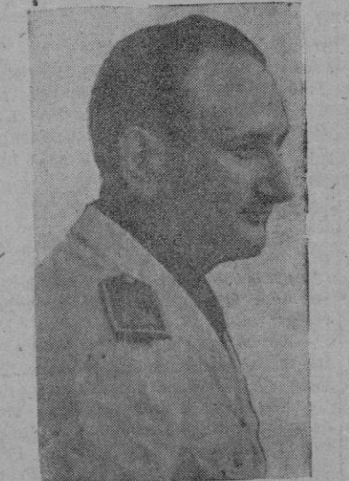
El Excmo. Sr. Ministro Secretario General

Y es que la Falange no fué, como muchos quieren, una invención retorcida de gestos y posturas vacías de todo arraigo nacional y humano, sino por el contrario, fué la exaltación ordenada de una serie