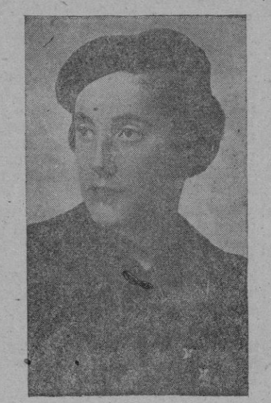
Pilar Primo de Rivera

concentración de la S. F. Le dijo Pilar Primo de Rivera jué el acto inaugural ha revestido extraordinario esplendor, efectuándose con arreglo al programa previsto sin que haya fallado ningún detalle. En los diversos actos intervinieron 10.000 cama-