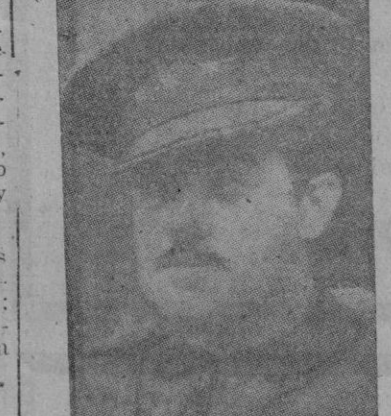
El Excmo. Sr. Ministro de Trabajo

La bandera sólo la eleva un hombre en Falange, es José Antonio, a quien sentimos emo-