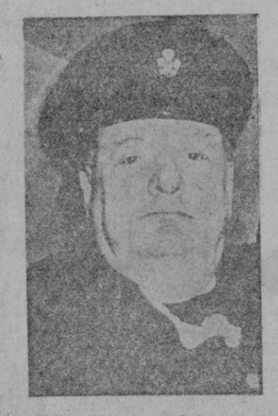
El "Premier" británico, Mr. Winston Churchill

do afligido, pero puede afirmarse que al discutir mucho se puso de manifiesto el fondo del acuerdo que permitirá al Imperio británico y al Commonwealth entrar en la discusión firmemente unidos con los grandes organismos restantes del mundo. Las naciones del Common-