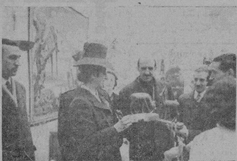
Madrid. — La esposa del Caudillo, acompañada de otras jerarquías, visita la exposición de Alfombras y Tapices en el Mercado de Artesanía.

Con carga completa de 25 hombres equipados, el "Horsa" pesa cinco toneladas. El tren de aterrizaje se halla sujeto al modo llamado triciclo, standardizado en los aviones comerciales y militares de gran estructura.