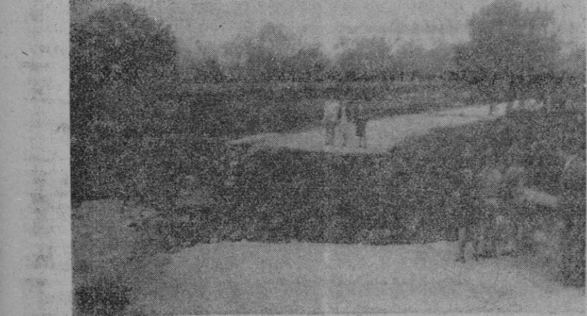
Desde el puente de la carretera de Artá a Son Servera, situado en primer término, se percibe el corte de unos cinco metros que causaron las aguas