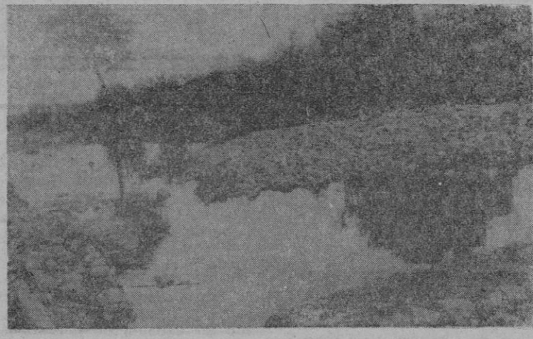
Antes de los temporales, el lugar que recoge la foto era espléndido huerto. — Ahora, gran desmonte de piedras (el de la foto, que se recoge sólo parcialmente, tiene unos 20 metros de ancho por más de 40 de largo). cubren las tierras y las ruinas de una noria

Mas el principal daño, prontamente se advierte, no son la inmundación de las aguas, que podría esperarse que paulatinamente se fuera filtrando. La corriente se lo ha llevado todo: manzanos y naranjos y toda clase de árboles frutales; hortaliças, patatas y moniats a punto de recoger; mas, también se ha llevado toda la tierra de labor y ha dejado inútiles para el cultivo grandes extensiones de terreno. Las zonas destinadas al cultivo de habas, no han sido más afortunadas que las del trigo: con las simientes, también han sido llevadas al mar, grandes cantidades de abonos orgánicos y miles de toneladas de superfosfatos esparcidos recientemente para que fueran más féculas las próximas cosechas. En los caminos vecinales se nota también la devastación. Muchos de ellos han quedado cortados y la gran fuerza de la corriente llevóse toda la tierra