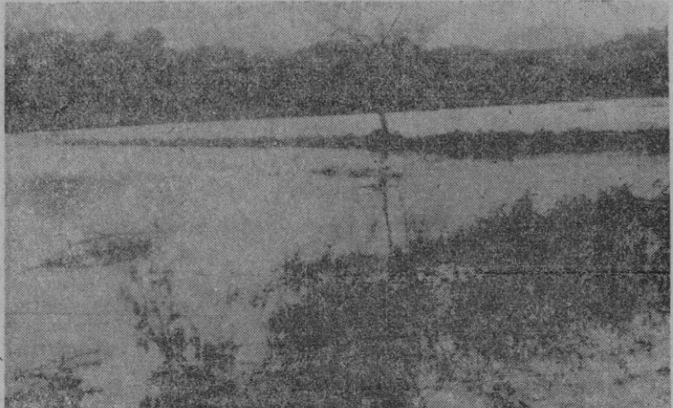
Otro aspecto de la devastación que en las afueras de Artá causaron las aguas

Mas en la gran catástrofe que todo ello supone para Artá, algo muy importante pudo salvarse casi enteramente. Nos referimos al ganado vacuno, al de cerda y al lanar. Por fortuna el alud de las aguas se presentó cerca del mediodía y ya a primera hora de la mañana lo presentieron los agricultores y tuvieron tiempo de retirar casi todos los ganados. En algunas partes, por ejemplo, en que cuerdas y establos ya estaban parcialmente inundados, vacas, yeguas y caballos y cerdos y vacas tuvieron que ser izados con cuerdas por buen número de hombres desde lo alto de las casas, tras titánicos esfuerzos; por si el aluvión llega durante la noche, seguramente los daños en la riqueza pecuaria hubieran sido enormes. No fué tan fácil salvar diferentes partidas de trigo.