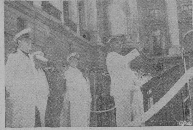
S. E. el Jefe del Estado, Generalísimo Franco, durante su discurso en la plaza de la Armería ante la magna concentración de productores celebrada con ocasión del 18 de julio