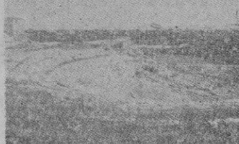
Siracusa (Sicilia). — Teatro griego

La ciudad es un bastión de importancia estratégica para las comunicaciones en Sicilia, pues el centro de las carreteras que se dirigen hacia los cuatro puntos cardinales de la isla.