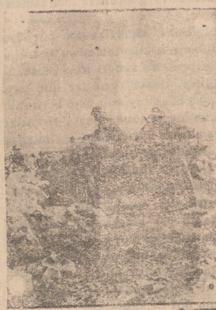
Nada es obstáculo para los motoristas alemanes para realizar sus misiones como enlaces o llevar pequeños aprovisionamientos. La foto que reproducimos prueba esta realidad.

BERLIN, 29. —La batalla en el Este sigue sin atenuar su violencia. El alto mando bolchevique dispone sin duda alguna de considerables reservas tanto en la zona de Witebsk como en la región de Jitomir, esta última en la que se encuentra el segundo centro de gravedad de la batalla. El ataque de gran envergadura iniciado por el Ejército de Watutin en la Nochebuena al oeste de Teterov en estrecha zona, ha ido enanchándose y prosigue con pronunciada tendencia a extenderse hacia Korosten, Jitomir y Berditschey. Contra esta última ciudad parece que va dirigido el ataque principal de las fuerzas soviéticas.»—EFE.