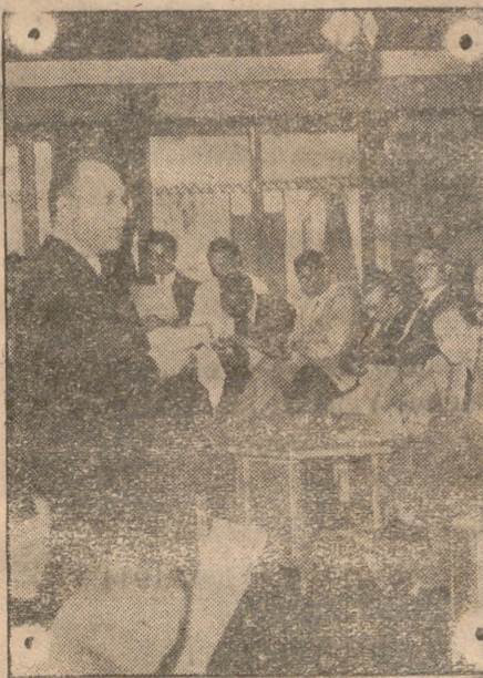
En una conferencia de Prensa en Tokio, el jefe del Gobierno Hindu, Shubas Chandra Bose, habla de la liberación de la India y de la voluntad de luchar por la realización de esta idea.

Compañía Española seguros diversos precisa Subdirector en esta provincia, con gastos de representación, dietas e importantes comisiones. Apartado, 252.—Madrid.