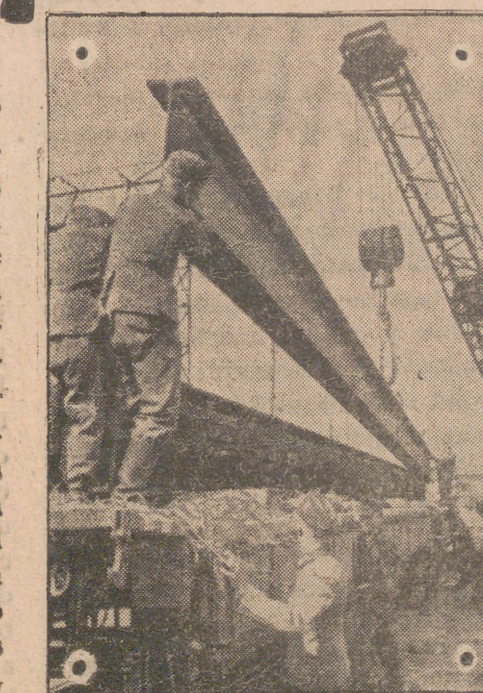
Hasta las grandes piezas de hierro de los puentes son recogidas por los alemanes que dejan convertido en desierto el territorio que abandonan en el Este.—(Foto «Presamundo»).

Estos podían anteriormente actuar a placer; ahora no. Las operaciones de los bombarderos y «Stukas» alemanes contra el tráfico de abastecimiento de los aliados no son, empero, muy frecuentes. Son, en cambio, de extraordinaria eficacia, como por ejemplo el ataque contra el convoy frente a la costa de África del Norte, que impide llegar los