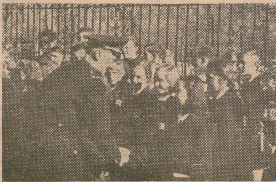
MADRID.—El delegado nacional del Frente de Juventudes saluda a un grupo representativo de las Juventudes Hitlerianas que visitan España.