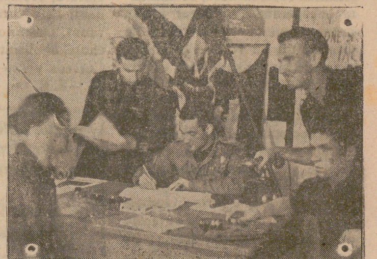
Bajo las banderas del nuevo Ejército Fascista Italiano, se inscriben todos aquellos que han juramentado fidelidad absoluta al Duce Benito Mussolini.

Ahora ya se van descubriendo hechos si se quiere escribir la historia de determinados sucesos. Como dato interesante para lo que se diga en lo venidero, se conoce el informe que un oficial de la marina italiana ha hecho del ataque inglés llevado a cabo hace dos años a Tarento por aviadores británicos. Dice así: «En