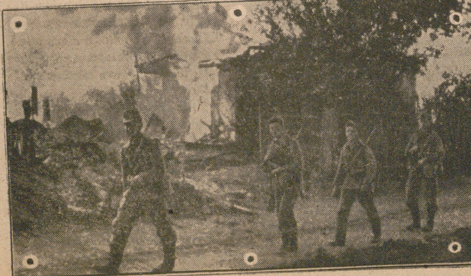
Este documento gráfico muestra al último grupo de soldados alemanes que abandona un poblado después de su total destrucción.