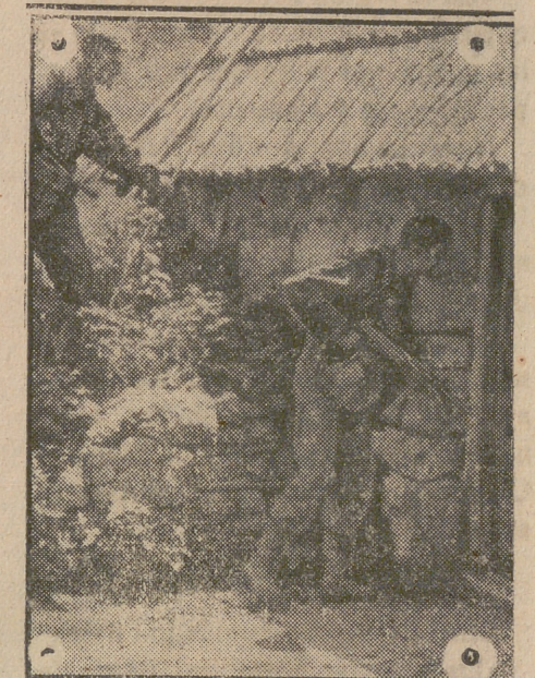
En todas las regiones de Rusia donde actúan las bandas comunistas una policía especial alemana procede al exterminio de éstas.

ROMA, 10.—El Rey Emperador ha nombrado ministro del Interior al senador Ricci en sustitución del anterior que ha dimitido.—EFE.