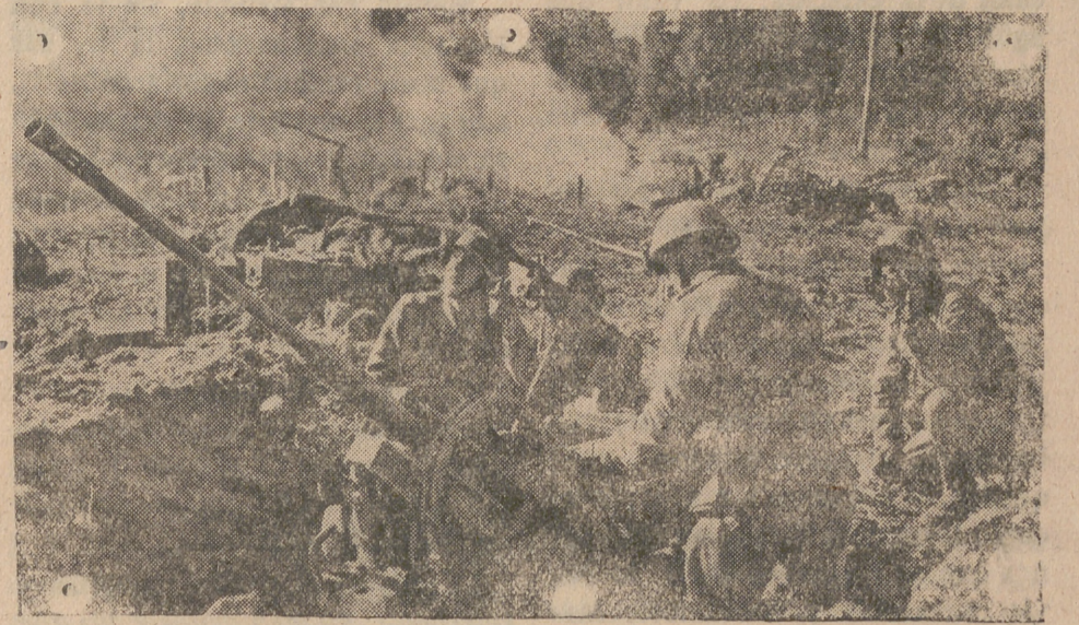
Artillería ligera antiaérea finlandesa