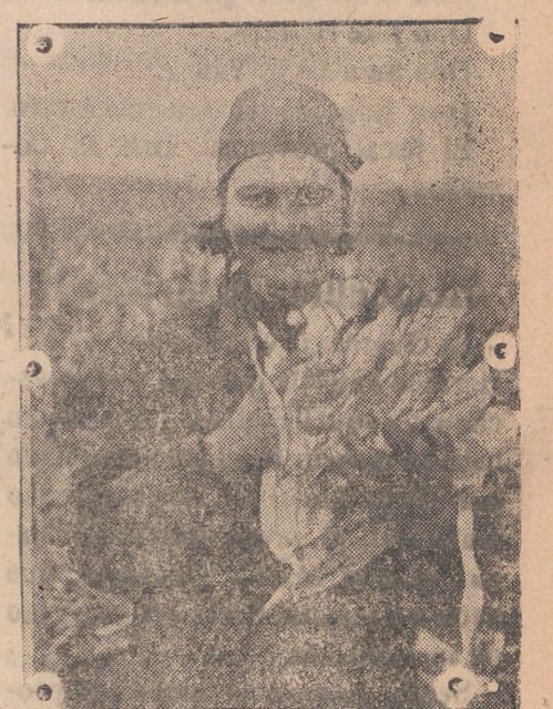
Mujeres rusas que durante todo el invierno y primavera trabajaron asiduamente en las faenas agrícolas, ahora rien satisfactoriamente al ver su nueva cosecha.