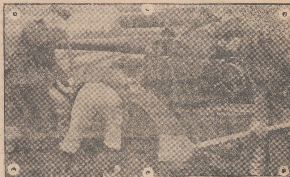
A pesar del barro del Este, estos soldados alemanes consiguen el cambio de cañón emplazado ante las posiciones rusas.