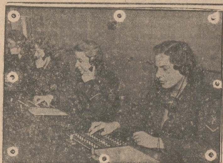
Muchas mujeres alemanas, en su trabajo de establecer las comunicaciones entre el frente y los puestos de mando.