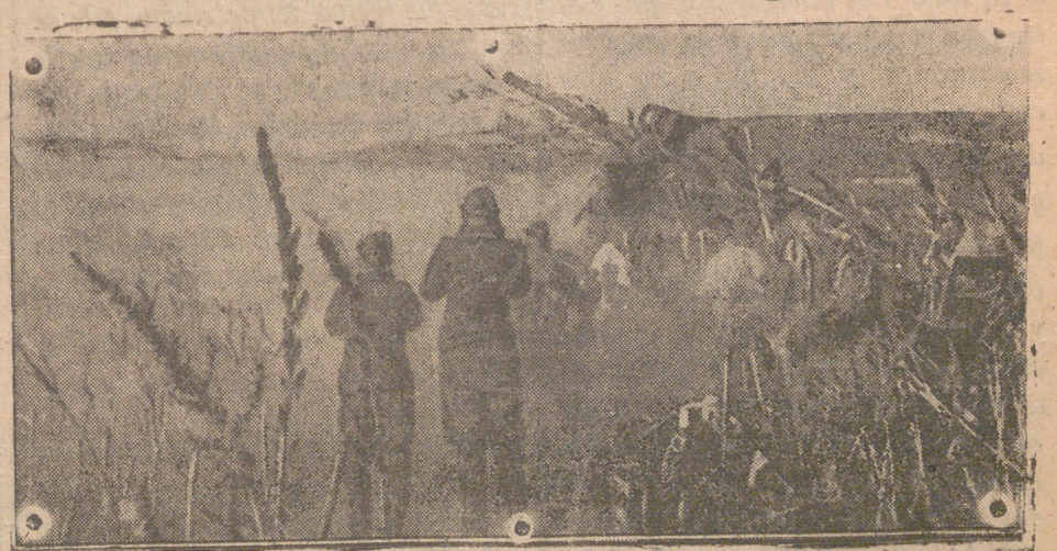
Un cañón pesado alemán, dispara sobre las líneas de comunicación de los bolcheviques en el sector de Maltgotek, en el Cáucaso