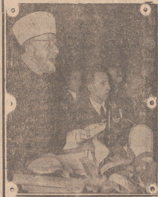
En la sesión inaugural del Instituto Central Islámico de Berlín, el Gran Mufti de Jerusalén, pronuncia un discurso retransmitido al mundo árabe por las emisoras de radio alemanas e italianas