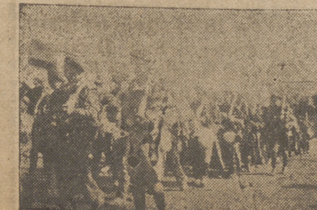
Los valerosos muchachos se lanzan hacia lo desconocido en anhelos de ejecutorias legendarias

Aprobado por la Censura Central con el número 2380