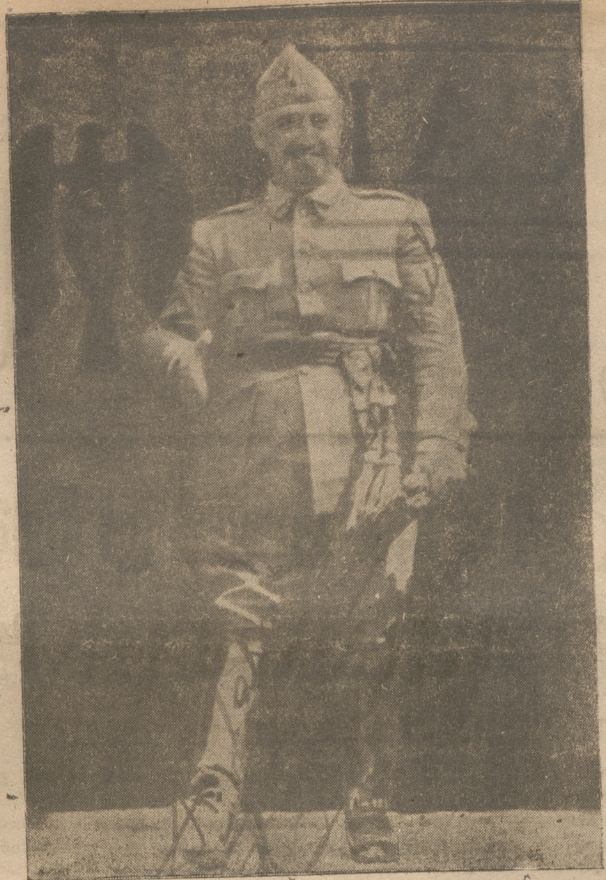
Con la fe en Dios y en la Santísima Virgen María, impulsado por vivo ardor patriótico, el General Franco dió la voz de guerra el 18 de Julio de 1936, a la que respondieron los españoles auténticos enardecidos para una heroica y gloriosa Cruzada que se inició al grito de «Por Dios y por España» contra el criminal marxismo sin Dios y sin Patria.