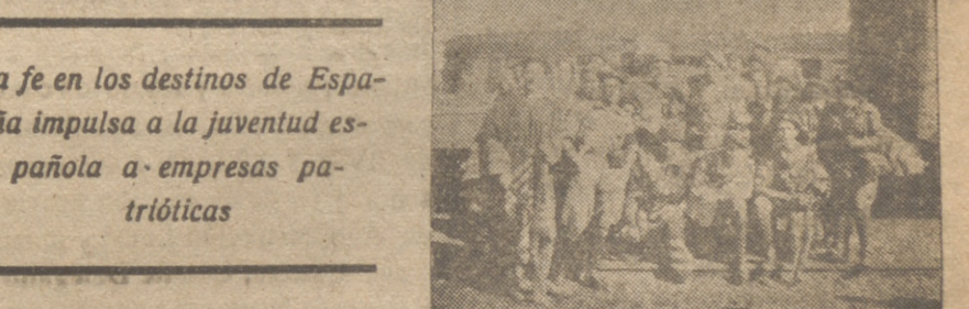
La fe en los destinos de España impulsa a la juventud española a empresas patrióticas