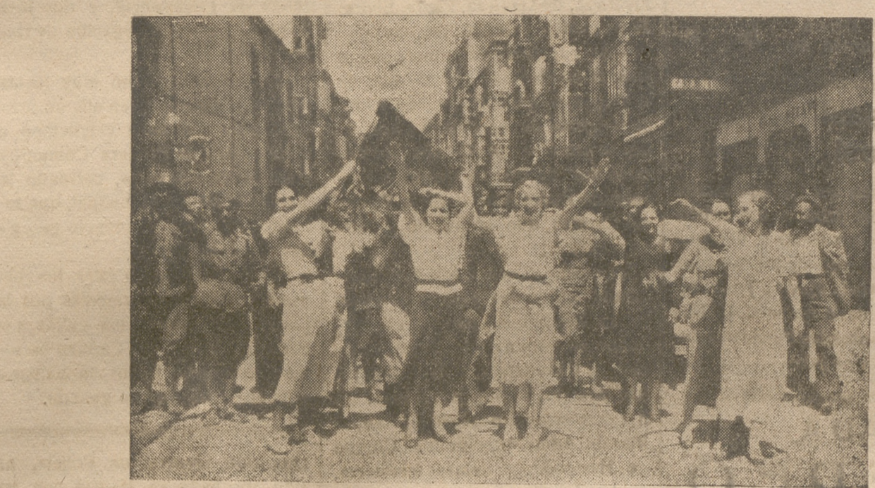
Al grito de guerra lanzado por el bravo Ejército Español, responden los patriotas con vítores jubilosos populares que son nuncios de un glorioso amanecer para la Madre Patria.

Se celebran en la iglesia de San José (Las Madres). Exposición a las once de la mañana. Preces y reserva a las siete de la tarde.