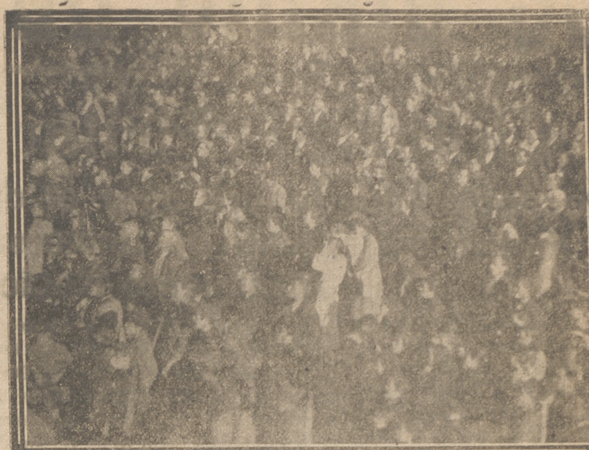
El público avilense estacionado ante el Palacio Consistorial donde acaba de llegar el General Mola una tarde de Agosto de 1936. El llorido general hubo de asomarse repetidas veces al balcón para recibir las ovaciones entusiastas de la ciudad de Avila, en la que venia a establecer su Cuartel General

Teniendo conocimiento esta Jefatura de que sustenta el criterio por algunas autoridades, industriales y comerciantes de esta provincia, que los precios de tasa, fijados por los Organismos competentes en materia de Abastos, deben considerarse inmodificables, se pone en conocimiento de las Autoridades, productores, detallista y público en general, que la tasa marcada no puede rebasarse en alza, pero que es lícito y mi Autoridad felicita a quienes vendan sus productos a precios inferiores a los señalados, por su interés en facilitar la labor de suministro a las clases modestas y la preocupación de abastecimiento de esta Delegación.