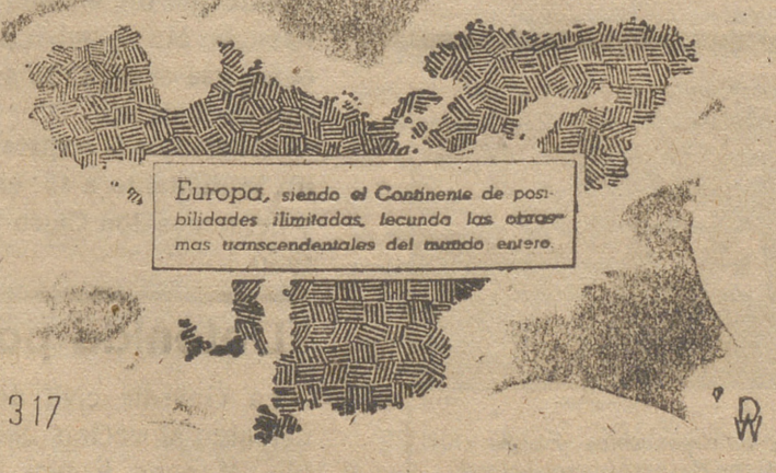
Europa, siendo el Continente de posibilidades ilimitadas, locando las otras mas trascendentales del mundo entero.