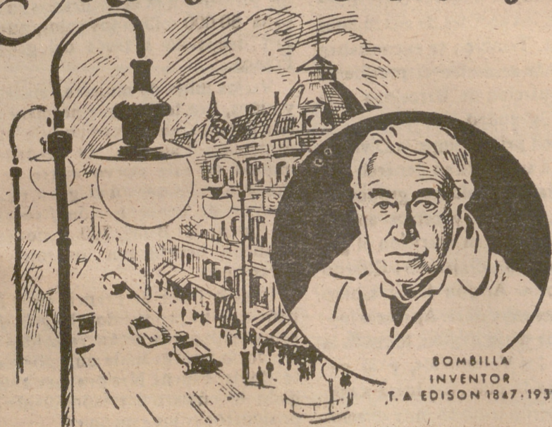
BOMBILLA INVENTOR T. A. EDISON 1847-1931

Todos los grandes inventos son fruto de ideas luminosas. Existen en el universo materias y energías, que utilizadas con el acierto de una feliz idea producen efectos asombrosos. He aquí el secreto de la INSTANTINA, combinación especial de eficacísimos elementos terapéuticos, inocuos y seguros, que cortan con la máxima rapidez los resfriados y sus consecuencias así como toda clase de dolores.