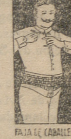
FAJA DE CABALLERO

Visítenos en AVILA el 21 de septbre, Hotel Inglés; SALAMANCA el 22, Hotel Pasaje; ZAMORA el 25, Hotel Suizo