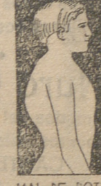
MAL DE POTT