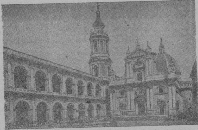
La basílica de Nuestra Señora de Loreto, Patrona de la Aviación

Un homenaje sentido al Arma alada de España, que continúa velando, tenso el brazo sobre las palancas de mando y ojo avizor sobre el horizonte.