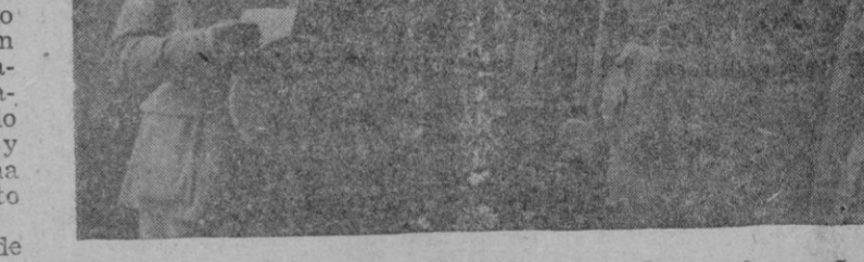
El Excmo. Sr. Capitán General, los Generales señores Utrilla y Fernández de Tamarit y el Coronel señor Rovira, asistentes al acto.

Lápida en mármol y bronce, conmemorativa de los Caídos por Dios y por España del Cuerpo de Infantería, obra del escultor T. Vila.