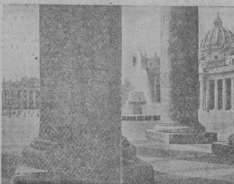
La Basílica de San Pedro vista a través de la columnata

Otras veces no es el particular. Es el auto del correo, y descarga infaliblemente un saco grande. Como que todos los días las peticiones de información superan las 2.000.