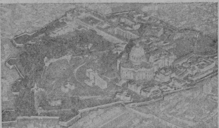
Vista de la Ciudad del Vaticano tomada desde un avión

sensiblemente en marcha esta máquina. Un mes apenas había pasado desde la ruptura de las hostilidades, en septiembre de 1939 y ya estaba el Vaticano procurando noticias de los polacos dispersos y auxiliándoles en su refugio ocasional, hallado unas veces en las naciones vecinas, otras a los pies mismos del Papa. Cuando después vino la caída del frente occidental y los fugitivos se desparramaron por Francia, el trabajo aumentó de pronto en forma insospechada. La Radio Vaticana recibía unas veces directamente las