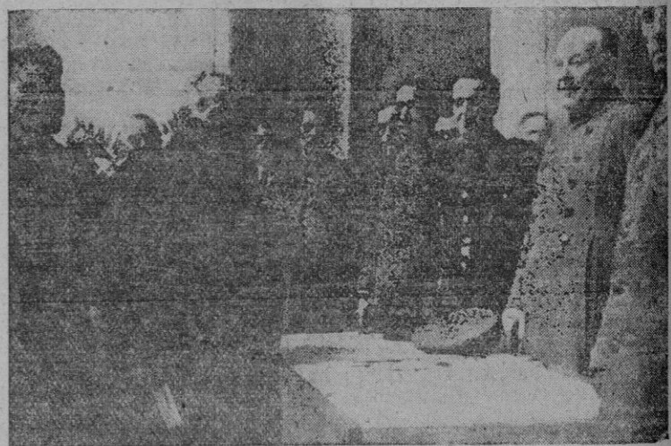
La Presidencia del acto