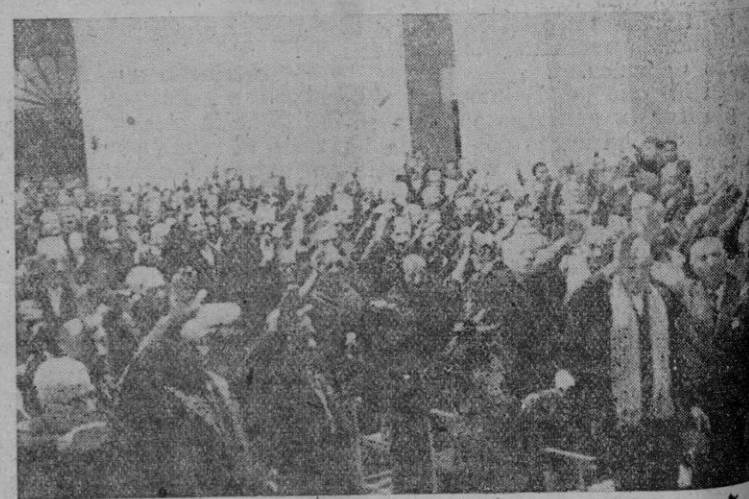
Los ancianos favorecidos saludan brazo en alto

El submarino "Neghelli", mandado por el capitán de corbeta Berghella, ha torpedeado y hundido a lo largo de las costas egipcias un crucero enemigo tipo "Southampton".