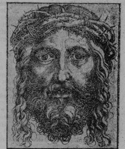
La Santa Faz (Alberto Durero)

Este salmo fué precisamente la última plegaria del Salvador del mundo en el momento culminante de su uso histórico sobre la tierra, a propósito de lo cual cabe señalar que Jesucristo, en los instantes de decisión y transcendencia parece no abia hacer otra cosa que echar ma-