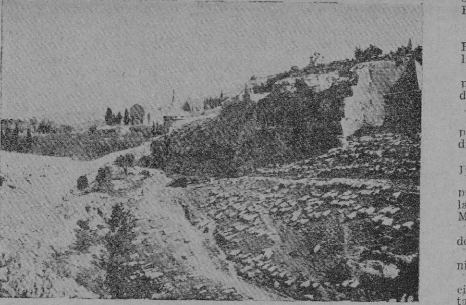
El valle del Cedron, en Jerusalem. En el fondo se ve la basílica de Getsemani

De conformidad con lo dispuesto en el artículo 17 de los vigentes Estatutos, se convoca a los señores cooperadores a la Asamblea General Ordinaria que tendrá lugar a las 10 horas del próximo domingo, día 4 en el local de la Asistencia Palmesana.