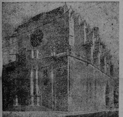
Ciudadela. — La Catedral

Asistiendo miles de personas, cantóse en la Catedral solemne Te-Deum