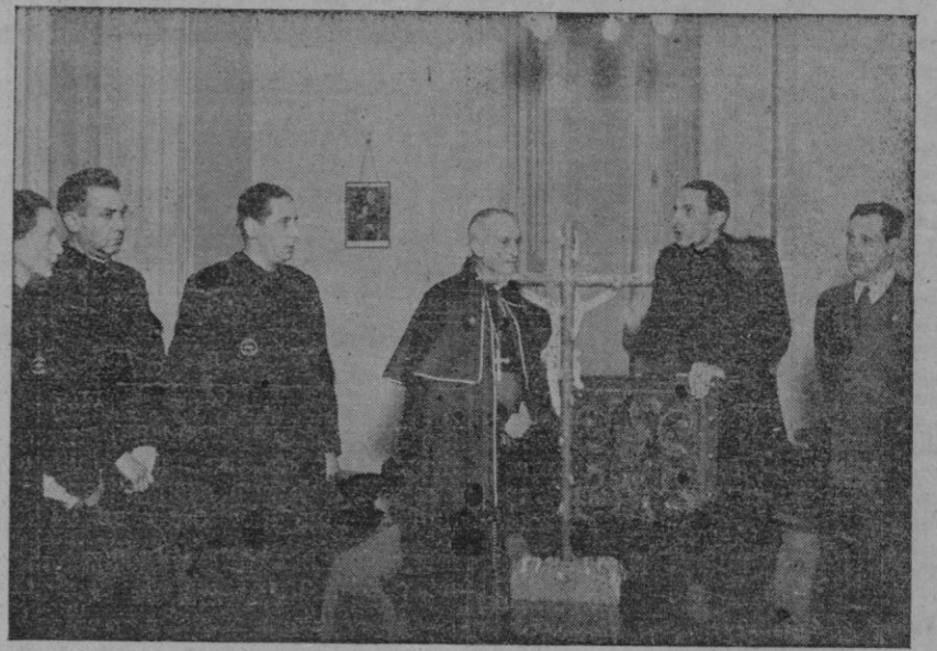
Madrid. — El Obispo de Madrid - Alcalá ha tomado posesión de la presidencia honoraria del Consejo de Cultura y Formación Nacional - Sindicalista de Organizaciones Juveniles. El asesor nacional, señor Pemartín, el consejero nacional, señor Halcón, y otras personalidades, en el acto de tomar posesión el Dr. Eljo.

En punto céntrico se vende casa vivienda de capacidad con dos entradas una para la casa y otra contigua para carros y caballerías dispone en su interior de un espacioso local con uadra apropiada para cualquier industria o fabricación, almacén etc., agua abundante. Informes, Hostales, 19.