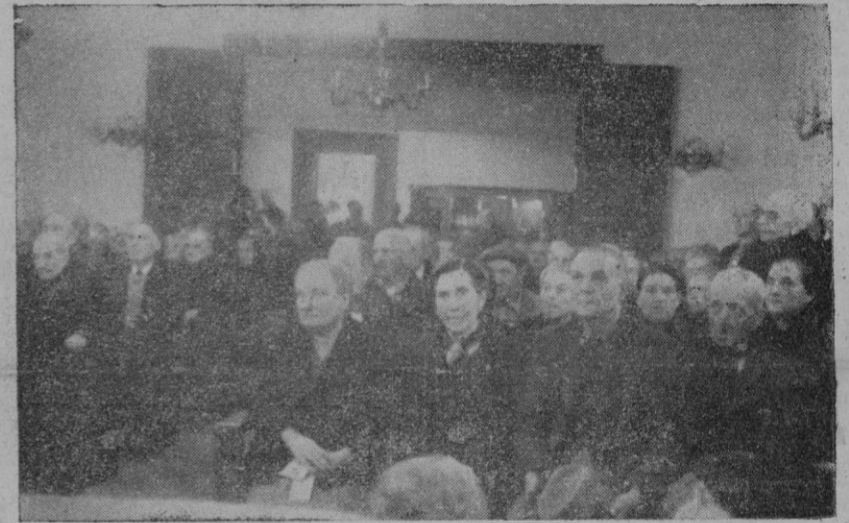
Vista de un grupo de obreros y obreras que ayer recibieron las dos primeras pensiones del Retiro Obrero

Y realmente, en la larga hilera de los que cobraban ayer sus dos primeras pensiones, sólo una viva satisfacción se reflejaba en todos los semblantes.