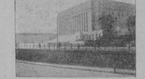
Helsinki. — El nuevo edificio del Parlamento

al corresponsal de la Agencia Havas que el ataque de referencia se inició el día 20, pero ya en el día de anteaer perdió algo de su intensidad. Aunque los rusos atacaron con fuerzas de importancia, los finlandeses no cedieron ante el ataque en masa de los soviets.