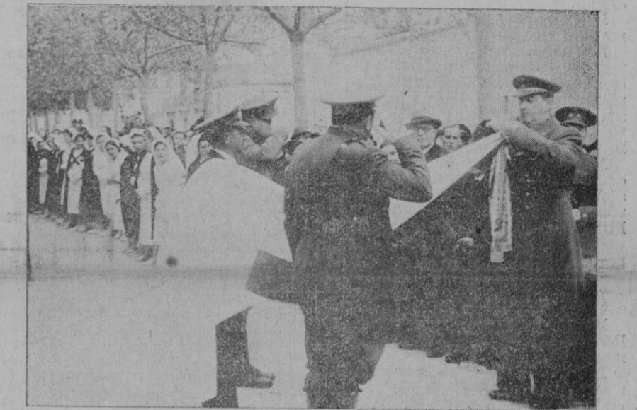
El General Kindelán condecora a las banderas