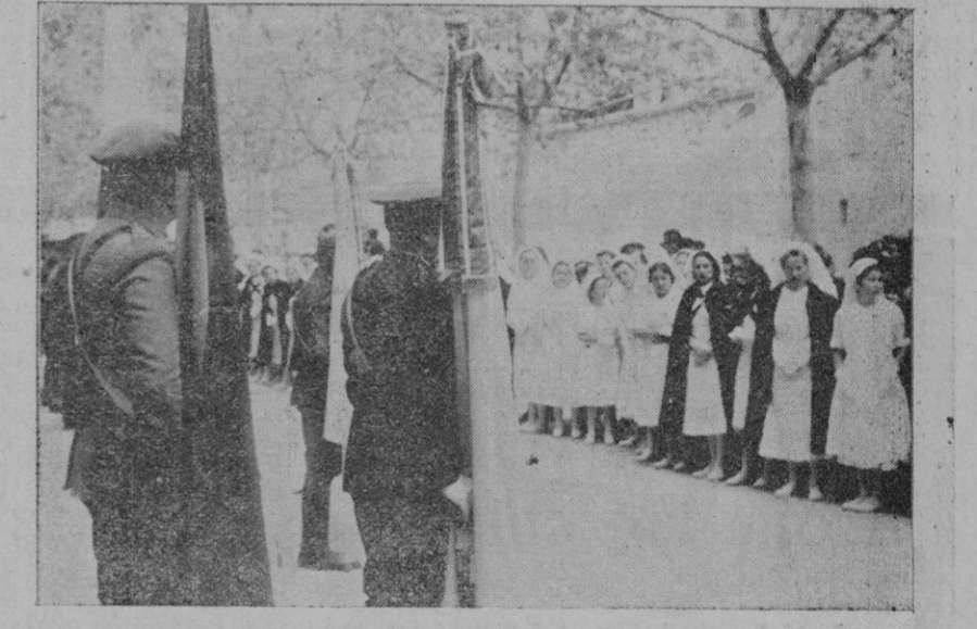
Las banderas condecoradas. Al fondo, las enfermeras de la benéfica Institución

Parece ser que el crucero se dirige, a escasa velocidad, a las islas Malvinas.