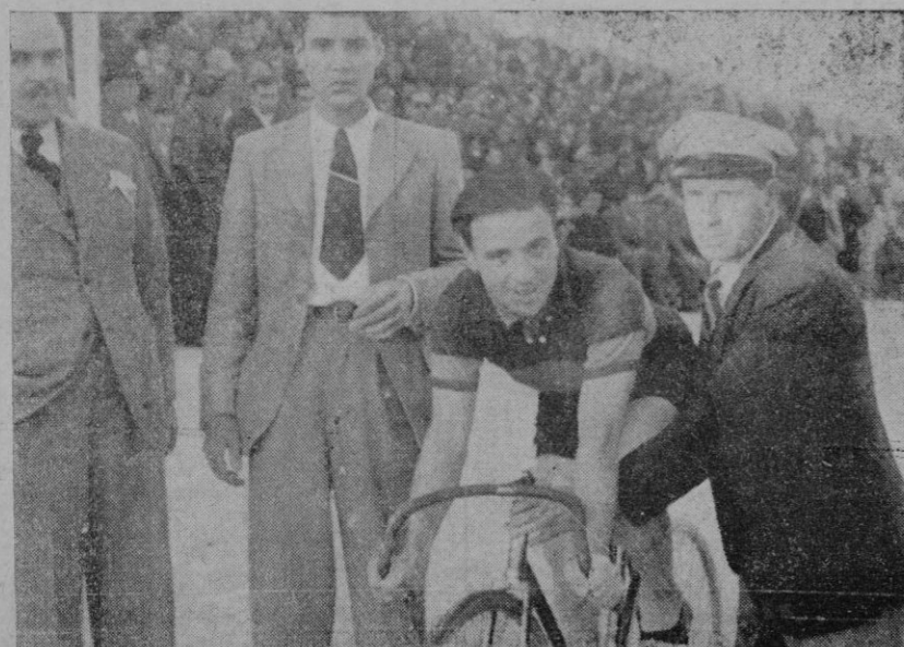
Plans, al disponerse a dar la vuelta de honor