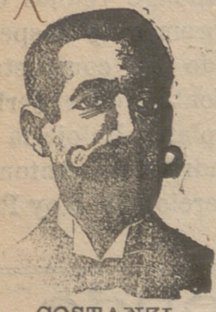
COSTANZI 284, Diputación, 284, BARCELONA