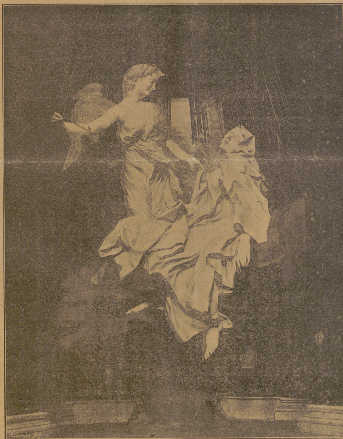
GRUPO EN MARMOL, OBRA DEL ESCULTOR BERNINI, EXISTENTE EN LA BASILICA DEL VATICANO