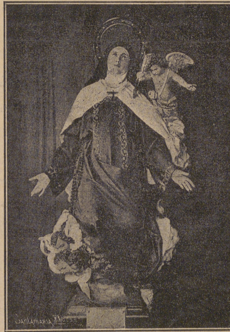
LA NUEVA IMAGEN DE LA TRANSVERBERACIÓN