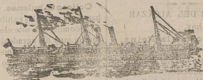
Tipo de los nuevos vapores de la Compañía