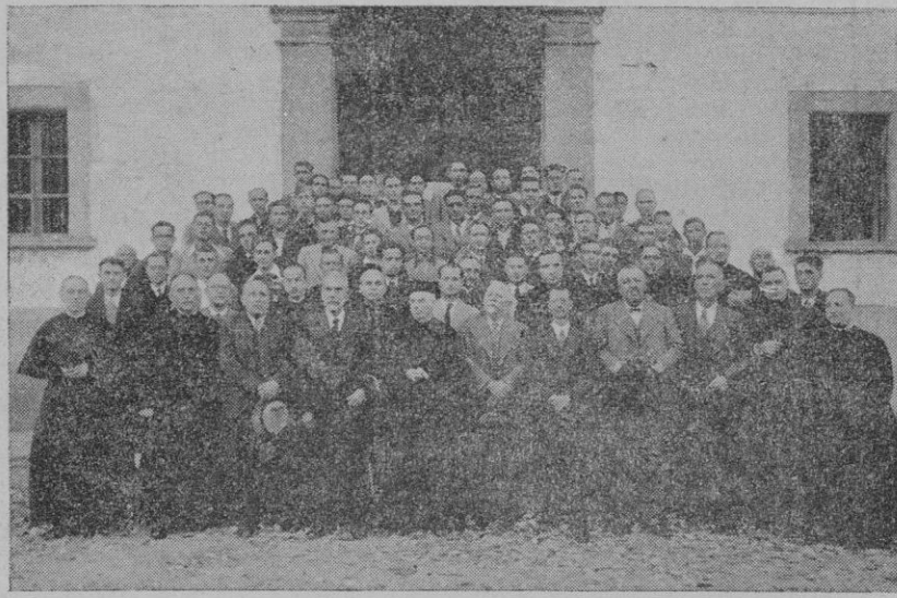
Los antiguos "blavets" reunidos a la entrada al Monasterio