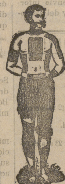
Trade Mark Registered

Curan reumatismo, resfriados, dolor de riñones, dolor de espalda, dolor de pulmones, lumbago, ciática, contusiones, etc., etc.