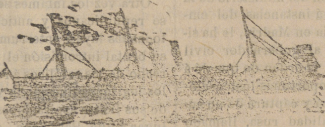
Tipo de los nuevos vapores de la Compañía.