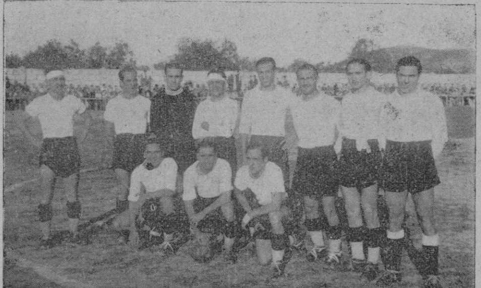
El once el "Constancia"