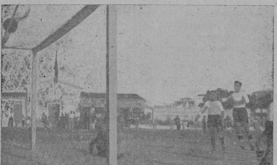
El primer goal de ayer tarde, en "Buenos Aires", logrado por Felipe