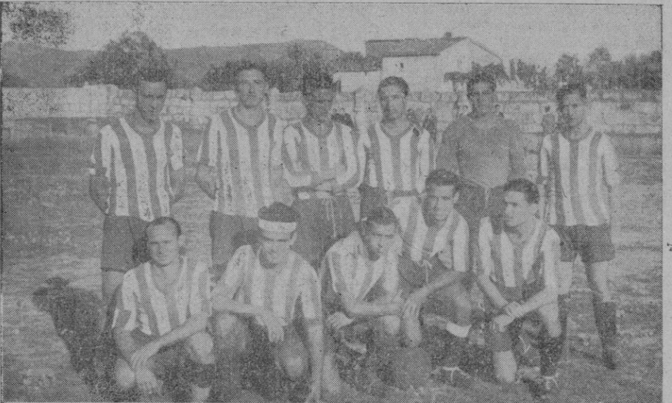
El once del "Athlétic"