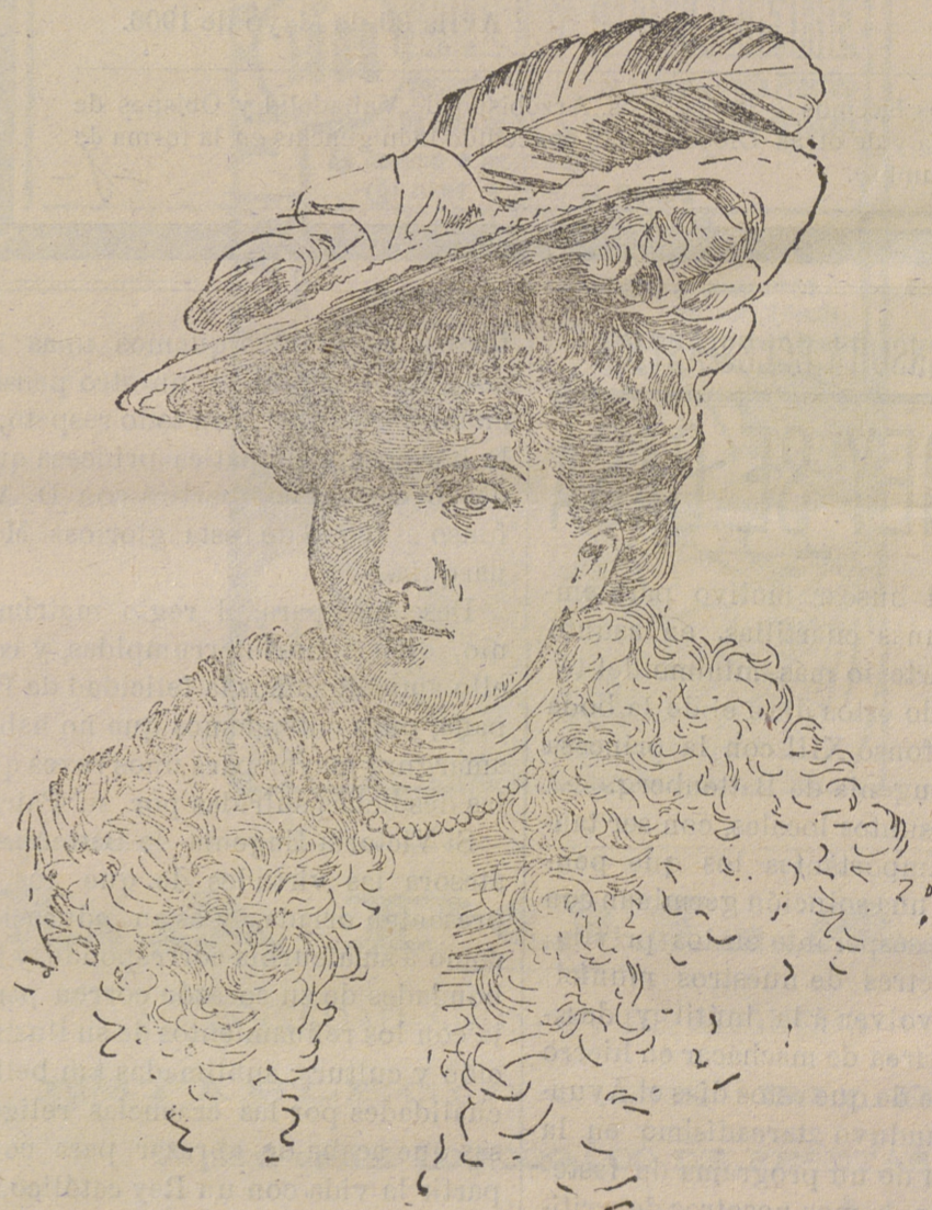
La princesa Victoria Eugenia de Battenberg, y S. M. Don Alfonso XIII, cuyo matrimonio se celebrará mañana. La futura Reina de España, nació en Valmoral, el 24 de Octubre de 1887, y es hija del difunto príncipe Enrique Mauricio de Battenberg y de la princesa Beatriz-María-Victoria-Feodora, gobernadora capitana de la isla de Wight, y gobernadora de Carisbrooke Castle, princesa de la Gran Bretaña, como hermana que es del Rey Eduardo VII. Fué madrina de la princesa la emperatriz Eugenia, que siempre profesó gran cariño á la princesa Beatriz, asegurando algunos que en vida de su hijo, el príncipe Imperial muerto á manos de los zúls, acarició la idea de casarlo con ella. De Don Alfonso XIII ningún dato consignamos, por ser todos ellos conocidos de nuestros lectores.