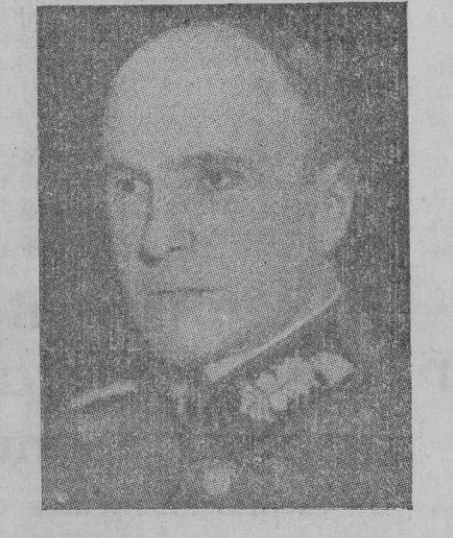
El General Von Brauchitsch, Jefe de las fuerzas del Reich

Agrega Von Brauchitsch que hoy, como ayer, el Ejército alemán sabrá emplear toda su decisión, su coraje y su técnica para demostrar al mundo que se tienen que respetar los legítimos derechos de Alemania, y para demostrar la superioridad militar de los ejércitos teodescos.