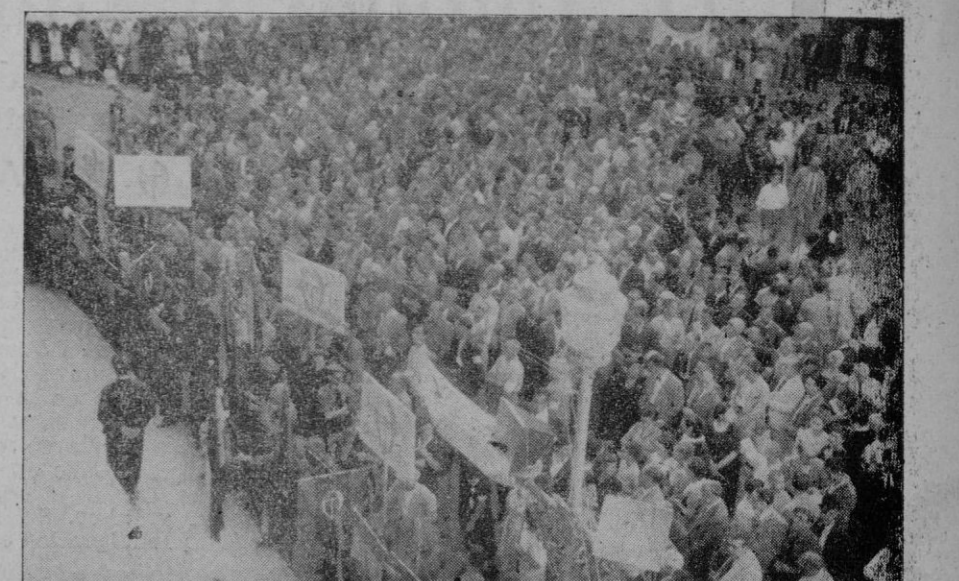
Grupo de obreros y empresarios de la C.N.S. durante los discursos que se pronunciaron en la Casa Consistorial