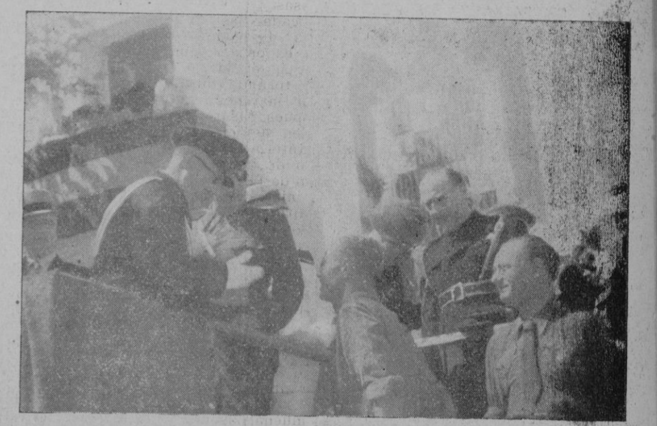
Momento en que unos obreros entregaban al Comandante Militar una artística arquilla obsequio de la C.N.S.