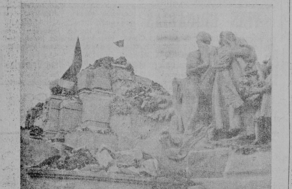
Un aspecto del grandioso monumento al Corazón de Jesús en el Cerro de los Angeles, que fué horriblemente profanado y destruido por las hordas rojas

Empresarios, trabajadores, todos; ¡Arriba España! nuestro Caudillo!