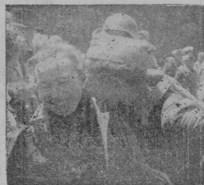
Nuestro repórter gráfico recoge, en las cuatro adjuntas fotos, otras tantas notas del emocionante recibimiento tributado ayer a nuestros soldados.

La publicidad más económica y eficaz, es la publicidad en la Prensa. Utilice CORREO DE MALLORCA. — Elame al 2-8-5-3.